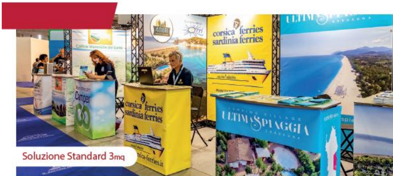
Soluzione Standard 3mq