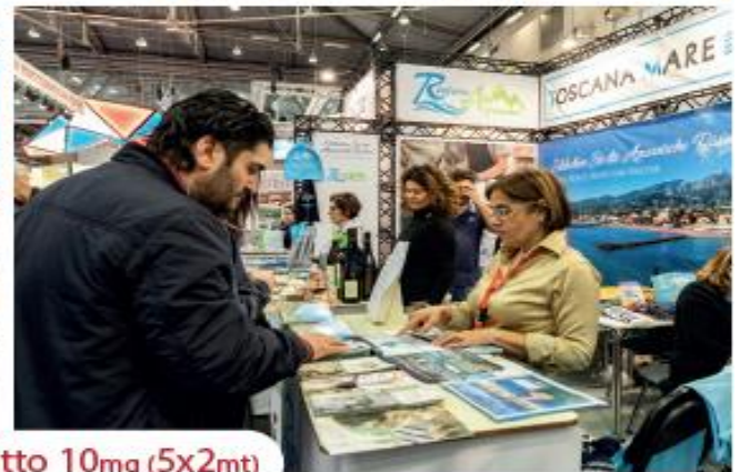
Soluzione Salotto 10mq (5x2mt)