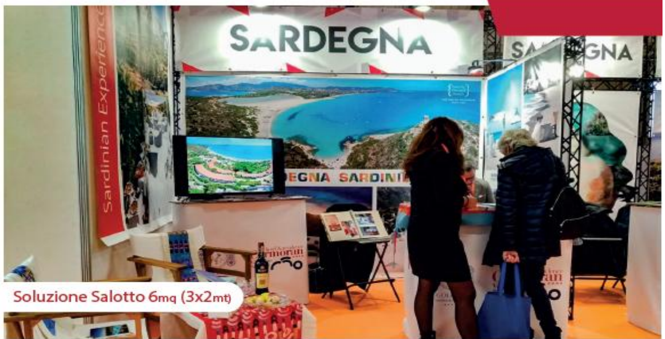
Soluzione Salotto 6mq (3x2mt)