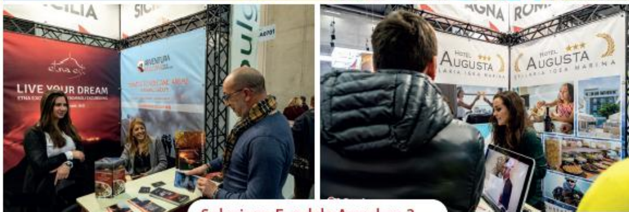
Soluzione Fondale Angolare 3mq